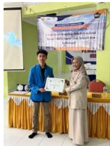
Gambar 2 Penyerahan Piagam dan Sertifikat