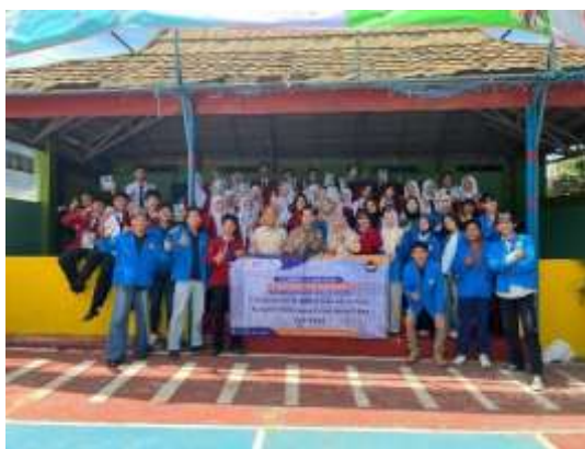
Gambar 3 Foto Bersama Tim PKM dan Siswa Peserta Kegiatan

Hasil kegiatan menunjukkan bahwa branding digital SMK Manggala telah memiliki kehadiran di berbagai platform media sosial, namun pengelolaannya belum optimal karena konten masih tidak konsisten, bersifat satu arah, minim storytelling, serta engagement yang relatif rendah ( \pm 2,5\% ). Konten didominasi foto dokumentasi dengan visual identity yang belum konsisten dan pemanfaatan video yang masih terbatas, padahal format video terbukti memiliki engagement lebih tinggi.